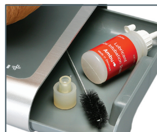
Schublade mit Füllung